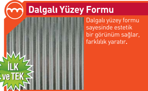
ONDULA 4 PLUS 20mm Temperli Çift Camlı